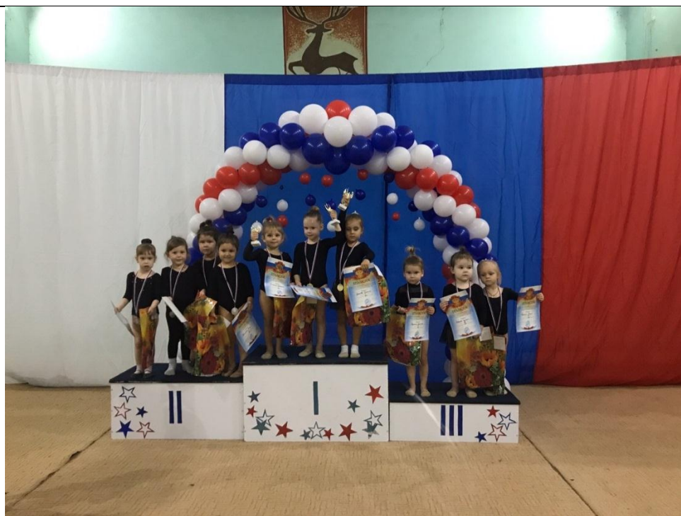
Награждение 2016 г.р.