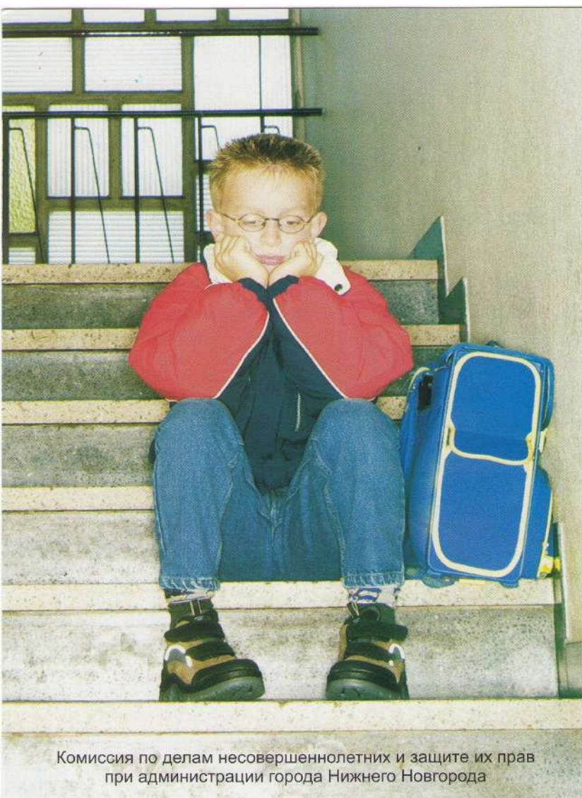
Комиссия по делам несовершеннолетних и защите их прав при администрации города Нижнего Новгорода